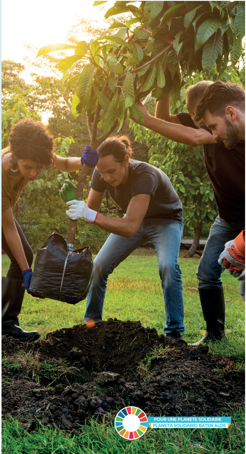
POUR UNE PLANÈTE SOLIDAIRE PLANETA SOLIDARIO BATEN ALDE