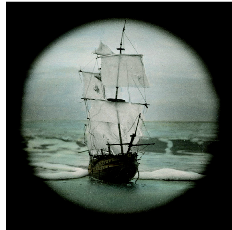
"Ex Voto 01" Pascal Mirande

Kazia Ozga: www.kasiaoza.com Pascal Mirande: www.pascalmirande.fr