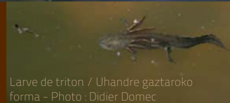
Larve de triton / Uhandre gaztaroko forma - Photo : Didier Domec

* L'URCPie AQUITAINE est composée des 7 structures suivantes réparties sur l'ensemble du territoire régional: CPIE du Béarn, du Pays Basque, du Littoral Basque en 64, du Médoc en 33, du Périgord Limousin en 24, du Pays de Serres Vallée du Lot en 47, et du Seignanx Adour en 40.