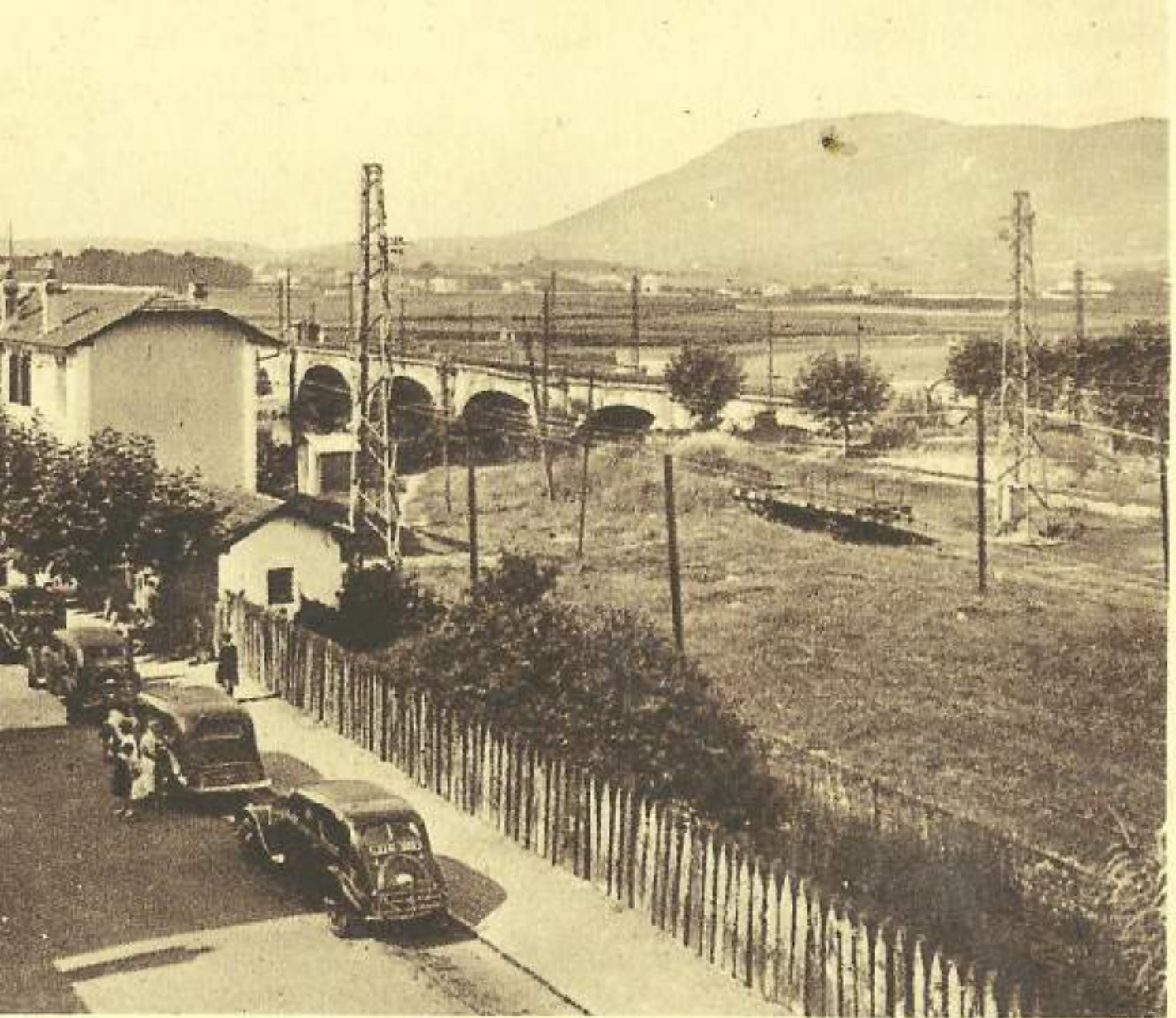
HENDAYE. - LES TROIS PONTS - AU FOND, L'ESPAGNE.