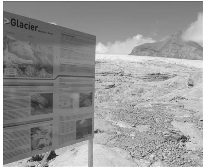
ILLUSTRATION 4 : Panneau thématique sur la géomorphologie et la dynamique glaciaire, en lien direct avec le site (Tsanfleuron, Alpes valaisannes) (photo : Simon Martin).

extraordinaire. Pour mettre en lumière les qualités géoscientifiques d'un lieu, souvent méconnues du public, un projet géotouristique devrait s'appuyer sur des géosites, c'est-à-dire des sites aux qualités (ou valeurs) reconnues : scientifiques (Grandgirard, 1999), esthétiques, culturelles, économiques ou écologiques (Panizza et Piacente, 1993; Reynard, 2005). Lorsqu'on s'intéresse plus particulièrement à l'usage touristique des sites, d'autres critères entrent en jeu comme l'accessibilité ou la valeur scénique (Pralong, 2005). La « facilité de lecture » d'un site, son potentiel didactique joue aussi un rôle (Kozlik, en cours). Par conséquent, tout géosite n'est a priori pas propice au géotourisme, et ce, d'autant moins si l'on s'adresse à un public de non-spécialistes.