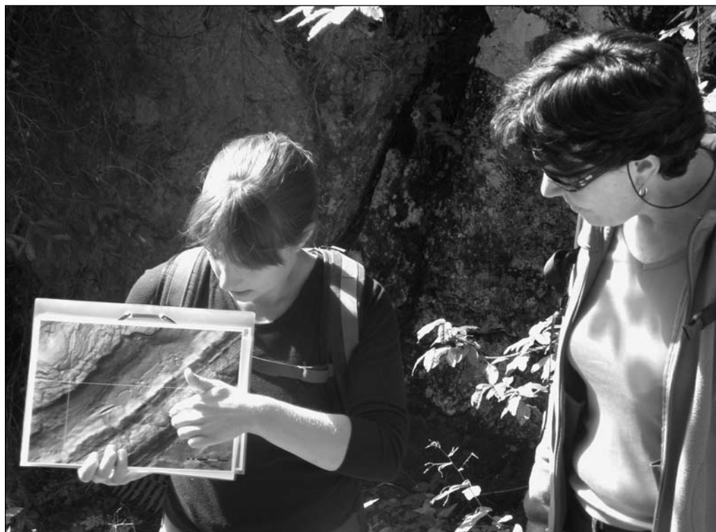
ILLUSTRATION 5 : Usage de supports visuels (modèle numérique de terrain) lors d'une excursion guidée sur les géomorphosites du Parc Jurassien Vaudois (Mont Sâla, Jura vaudois).

(brochure, carte, panneau), il sera très difficile de séparer clairement les différents discours sans augmenter la taille de l'objet, au risque de rebuter le lecteur dès l'abord. Enfin, tout site possède une ou plusieurs caractéristiques singulières qui « méritent la visite ». C'est sur celles-ci que l'accent doit être mis dans un processus de valorisation (Regolini-Bissig, 2010). Multiplier les thèmes abordés a surtout pour effet de noyer l'extraordinaire dans le banal et d'uniformiser le contenu des projets d'une même région, à l'instar des sentiers des Alpes de Suisse occidentale où l'on retrouve presque inévitablement un panneau sur la faune alpine ou la géologie régionale.