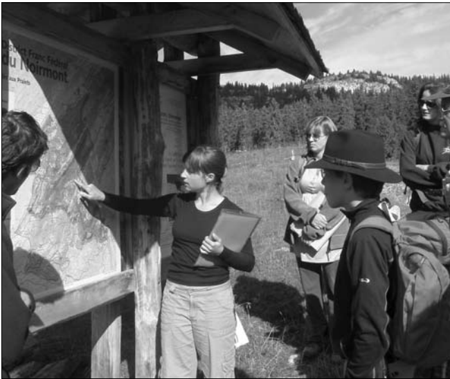
ILLUSTRATION 3 : Excursion guidée sur les géomorphosites du Parc Jurassien Vaudois, avec un public hétérogène (Les Pralets, Jura vaudois).